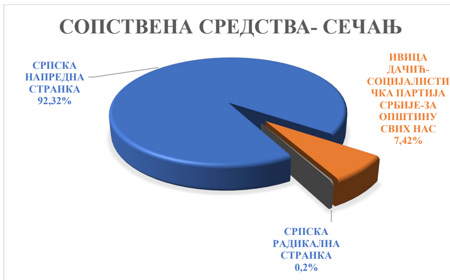
Графикон 4 Средства политичких субјеката из сопствених извора у Сечању

УКУПНИ ТРОШКОВИ ПОЛИТИЧКИХ СУБЈЕКТА ПО ВРСТАМА ИСКАЗАНИ У ИЗВЕШТАЈИМА О ТРОШКОВИМА ИЗБОРНИХ КАМПАЊА ЗА ИЗБОР ОДБОРНИКА У СКУПШТИНАМА ОПШТИНА МИОНИЦА, НЕГОТИН И СЕЧАЊ ЗА 2025. ГОДИНУ