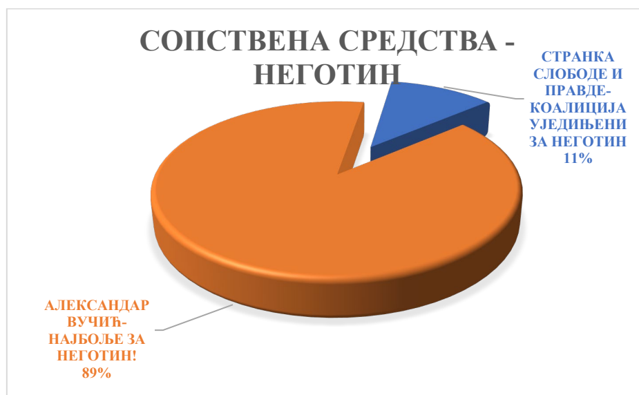
Графикон 2 Средства политичких субјеката из сопствених извора у Неготину