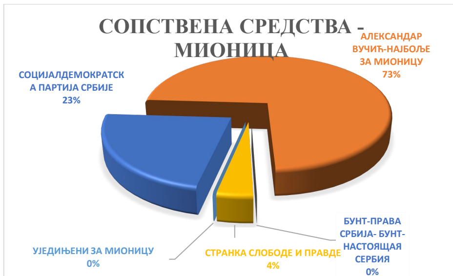
Графикон 3 Средства политичких субјеката из сопствених извора у Мионици